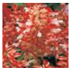
Red And White