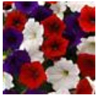
The Flag Mixture