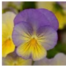
Blueberry Swirl Improved