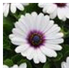
White Purple Eye