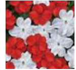
Cape Pine Mixture