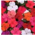
Formula Mixture Improved